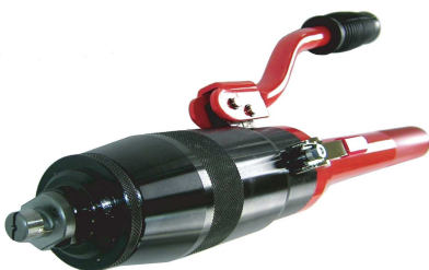
長穴刃物セット例