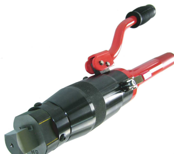
角19 横切刃物セット例