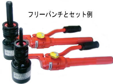
フリーパンチとセット例