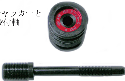
配電盤用チャッカーと CS-SSB 段付軸